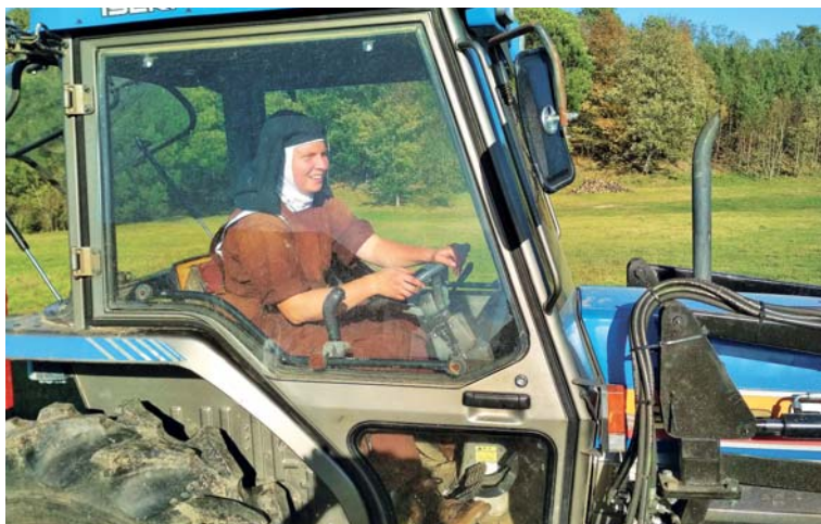
Sestry si umějí poradit i s traktorem.