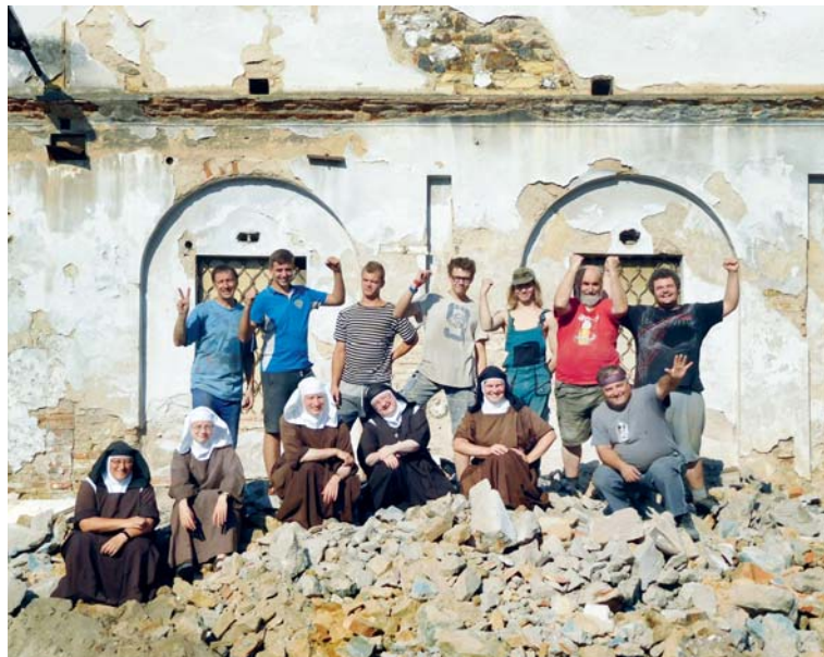
Výsledek práce se sběječkami – salesiánská brigáda.

2. Zcela určitě oživení osady, obnova velkého prostoru a okolí, příchod