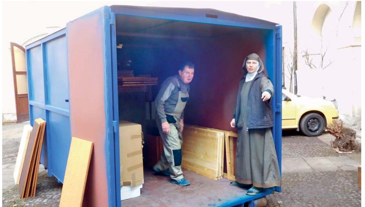
Nakládání nábytku pod bedlivým dohledem sester.

Letos na podzim nebo možná až na jaře příštího roku, podle toho, jak rychle budeme schopny vybrat stavební firmu, by měla začít stavba samotné klášterní kvadratury spolu s novou veřejnou kaplí. Buď tedy začnou přípravé práce na stavbu kvadratury, nebo budeme mít pár měsíců ke zklidně-