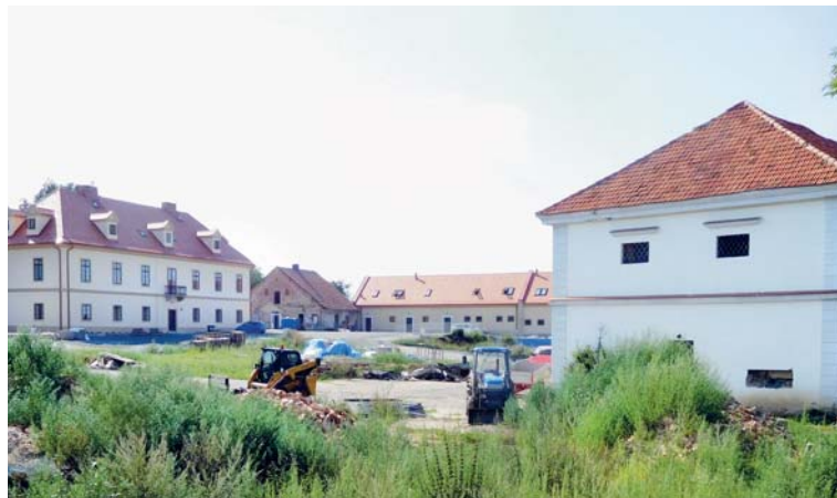
Areál kláštera v Drastech.

Kdyby se nás pragmaticky a racionálně založený křesťan zeptal, k čemu jsou takové kláštery dobré, nejspolitnější odpovědí by pro něj asi bylo, že (pomineme-li např. výrobu věcí k liturgii) nám sestry vyprošují Boží milost, ochranu a požehnání. A tato odpověď má smysl. My kněží dobře víme, že užitek pro duše není pouhým