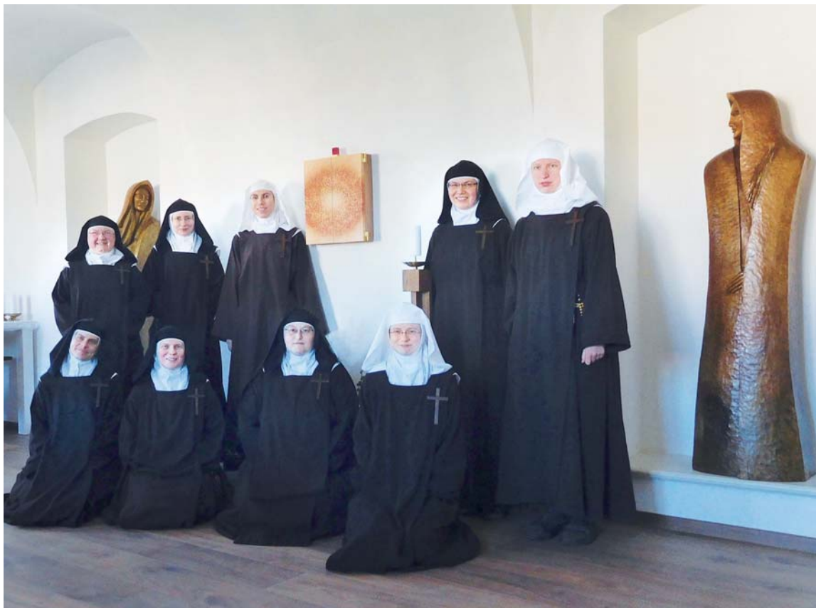
Komunita sester v kapli Domu Navštívení v Drastech.

1. Období stěhování bylo pro mne z fyzického hlediska dost náročné, bylo hodně co balit, třídit... Na druhé straně jsem však pociťovala velkou radost z toho, že jako komunita začínáme novou etapu našeho společného života. Etapu, která je spojená s naším projektem v Drastech: zvelebovat prostředí kolem našeho nového pozemku, a podílet se tak na oživování a ozdravování toho kousku země, který patří teď nám, a taky budovat nový klášter nejen pro naši, ale hlavně pro příští generace sester.