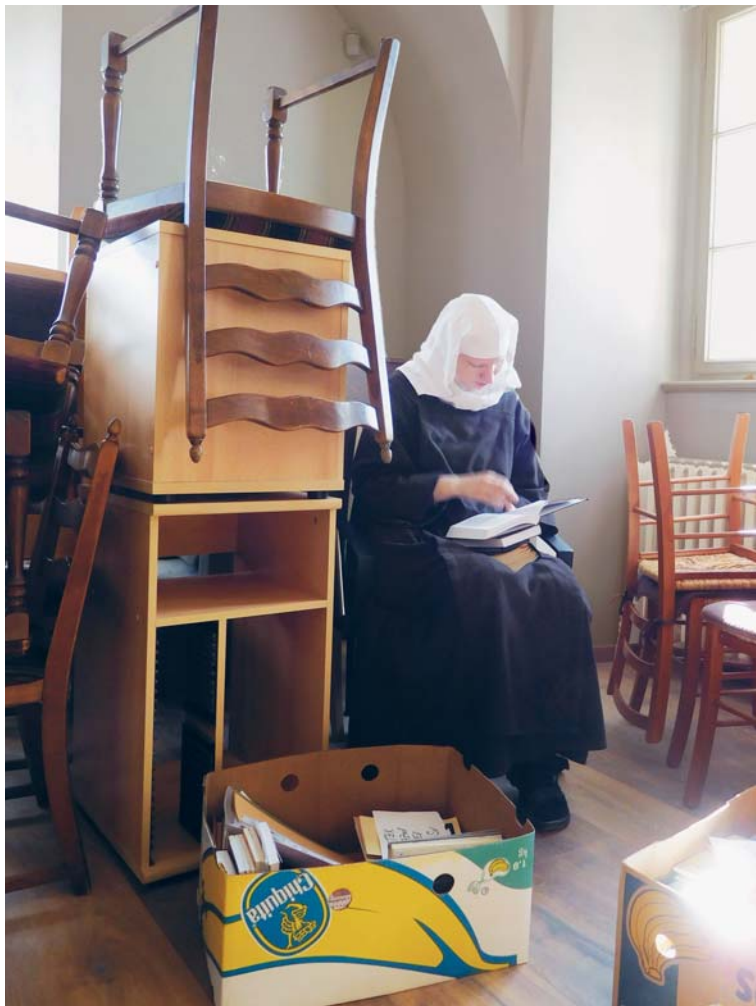
Kontemplace uprostřed všeho dění.