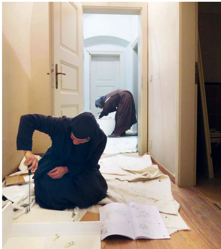
Sestavování nábytku se ujalý samy sestry.

4. Ve zdejších „stavebních“ podmínkách, kdy některé obvyklé prvky našeho života často berou za své, jsem si uvědomila, jak stěžejní jsou pro mě chvíle strávené v tichu s Pánem. Ať už můj den vypadá jakkoli, vnímám velkou potřebu aspoň určitou dobu „jen tak být“. O nic neusilovat, nic nevytvářet ani neříkat, jen se „vystavovat“ jeho přítomnosti a věnovat mu tu svoji. A on mě drží. Moc si přeji a modlím se, aby mě právě skrze nároky současné situace Bůh učil hlouběji „být“ – pro něj a skrze něj pro druhé.