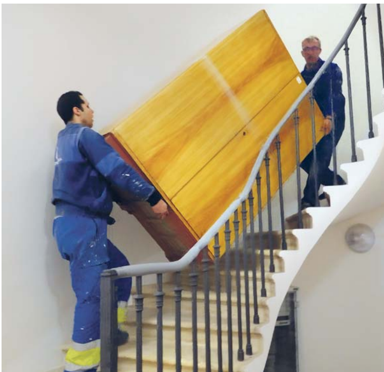
Historické prostory daly zabrat všem zúčastněným.

Musíme počkat, s jakými cenovými nabídkami přijdou jednotlivé stavební firmy, protože jsme upozorňovány na to, že situace ve stavebnictví je již několik let velmi nepřehledná. Nicméně již teď víme, že bychom potřebovaly pokrýt sbírkami naše financování domu pro hosty, abychom měly dostatek prostředků na vlastní klášter. Zatím jsme na něj vybraly kolem 30 procent nákladů, celkem stál 40 milionů korun. Jsme velmi vděčné všem našim dobrodincům, za které se každý den modlíme. TOMÁŠ KUTIL