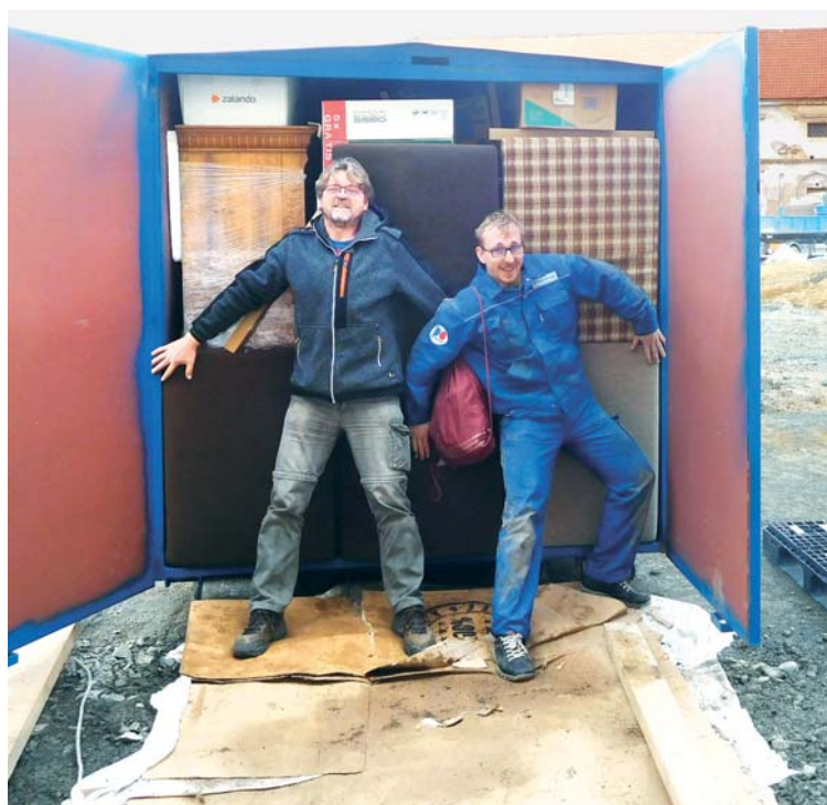
Kontejnery byly zaplněné do posledního místa.

Kolaudace proběhla na Pannu Marii Lurdskou 11. února. Hotový byl v tom smyslu, že se do něj dalo nastěhovat a bydlit v něm.