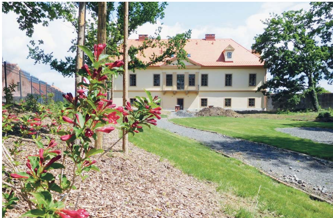
Budoucí dům pro hosty už je téměř hotový. Než se podaří postavit vlastní kvadraturu kláštera, je domovem sester.

Na mnoha místech v Novém zákoně bývá křesťanský život popsán obrazem budování. Je důležité vědět, že nejde o stavby a cihly, ale jde o život – to, co nás vnitřně buduje ve svatý chrám v Pánu, v Boží přibytke (Ef 2,21-22), je Boží slovo. Boží slovo má moc nás zbudovat, když ho s vírou přijímáme, když se mu poddáme a poslechneme ho, když na něm postavíme svůj život. Jsme zvyklí v cír-