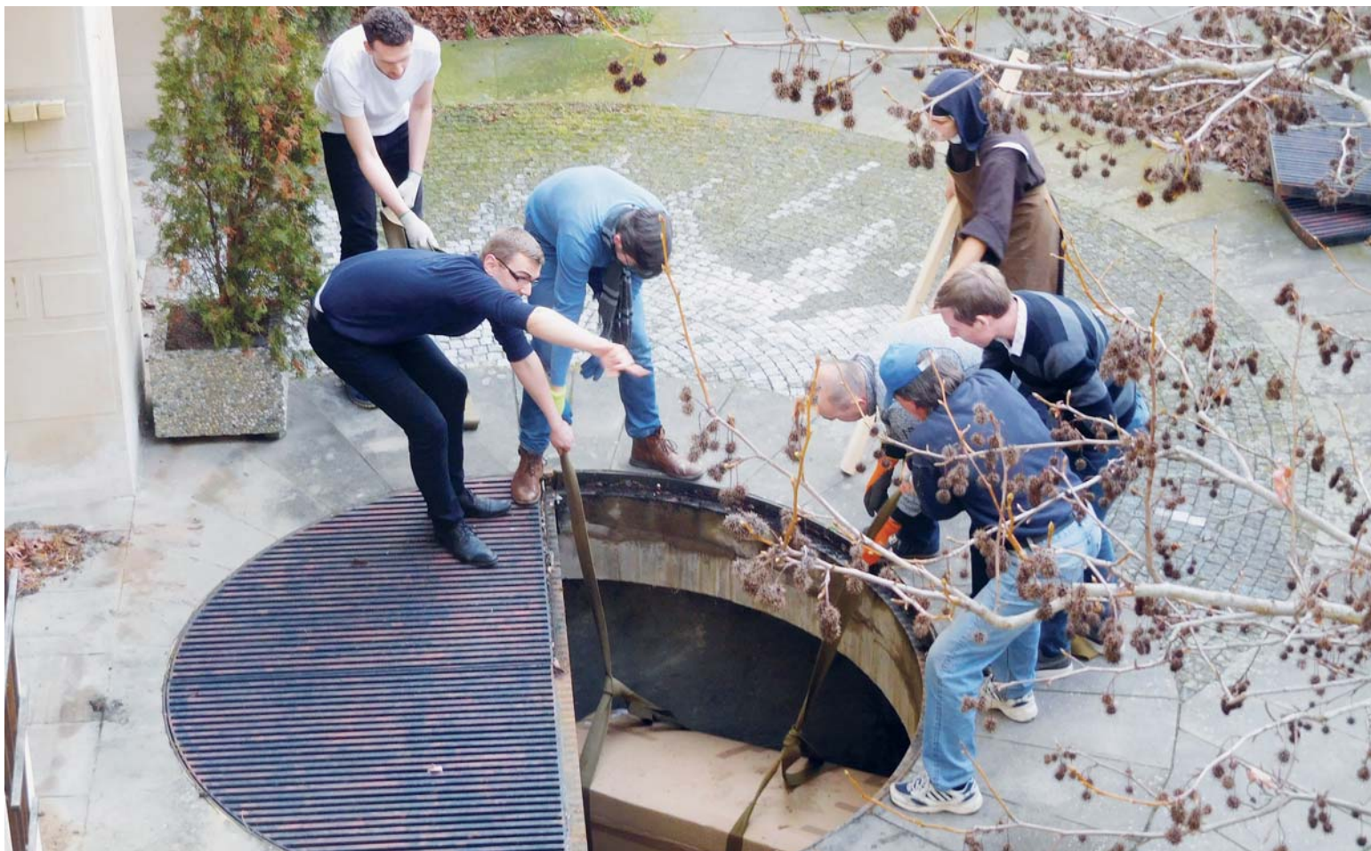
Při náročném stěhování kláštera pomáhalo mnoho ochotných rukou. Bohoslovci například vytažovali mrazáky ze sklepa. Na Hradčanech nemohlo nic zůstat.