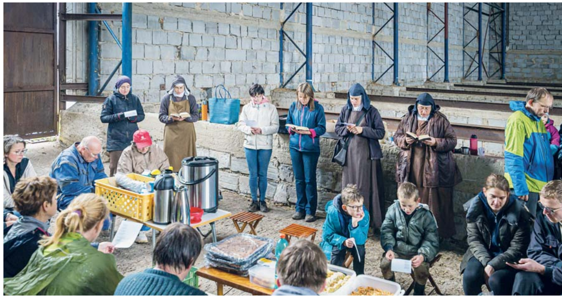
K brigádám patří i společné jídlo a chvíle modlitby.

Třetí úplně nečekáný dárek: sestry z Karmelu. Radostné, vyrovnané, odevzdané, zkrátka duchovní. Až později mi došlo, jakou unikátní příležitost jsem měla k seznámení. A naše krátká povídání – nad drnem plevele nebo při improvizovaném posezení u kávy ve stodole – navždy patří do mého vzpomínkového fondu. Některé dary přicházejí jen jednou a já pokorně děkuji, že jsem mohla vše, co mi Drasty za několik pracovních sobot nabídlý, s radostí a vděčností přijmout.