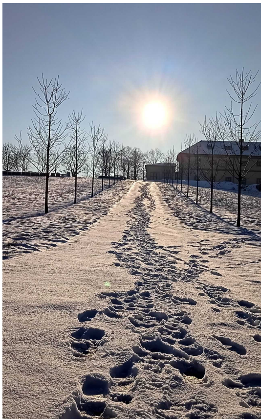
Třešňová alej vedoucí ke klášteru

„Znám své myšlenky, které mám o vás – praví Hospodin – to, co zamýšlím pro vaše blaho, a ne pro utrpení: dát vám budoucnost plnou naděje“ (Jer 29,11).