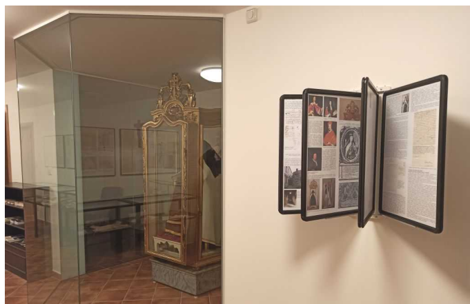
Muzeum matky Elekty s jejím neporušeným tělem v kryptě kostela